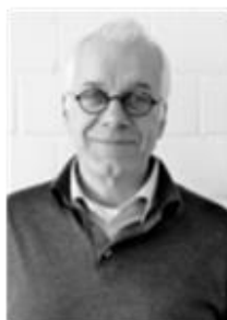
Prof. Dr. J. Alexander Schmidt Institut für Stadtplanung und Städtebau